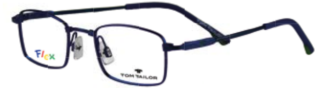
TOM TAILOR Kinderbrille